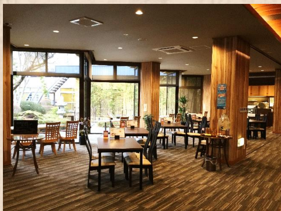
カフェレストラン

お食事にはカフェレストランをご利用くださいませ。 夜にお酒を楽しむなら囲炉裏バー「乃木」をどうぞ。 「時間制セルフスタイル飲み放題」が大人気です!