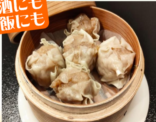
肉汁溢れる 肉焼売 850円