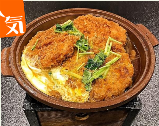
三元豚ヒレカツ煮陶板 980円