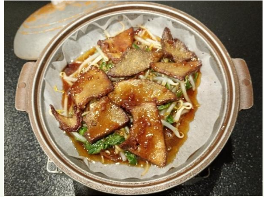
レバニラ陶板焼 780円