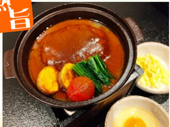
和風デミグラスソースの 煮込みハンバーグ 980円